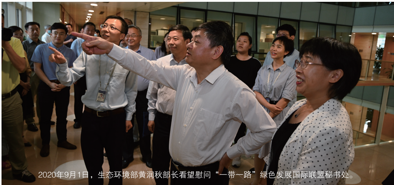
2020年9月1日，生态环境部黄润秋部长看望慰问“一带一路”绿色发展国际联盟秘书处。